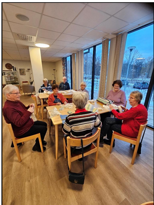
Arbetsträff för Kongo