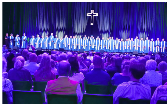
Pastorer och Diakoner ordinerades till tjänst.

Gud har en plan inför framtiden. Den presenterade han när han sände sin Son Jesus. ”Var och en som tror på honom skall få evigt liv”.